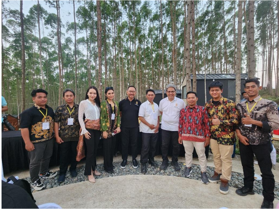
Kepala dan Wakil Kepala Otorita IKN foto bersama para influencer asal Kalimantan.