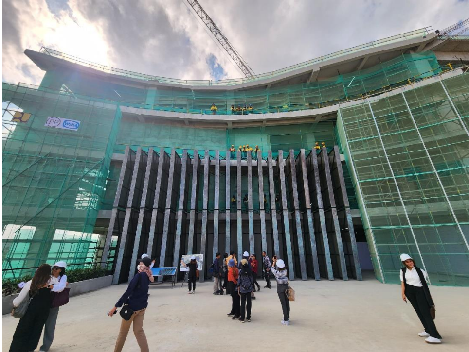
Tampak depan Istana Negara masih dalam proses pembangunan.