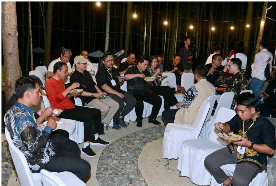
Makan malam bersama Presiden, jajaran Menteri, Kepala Otorita, dan para pegiat seni di lokasi Glamping.