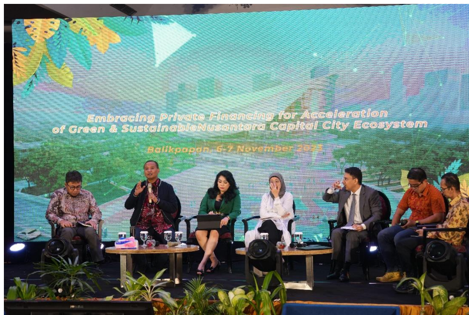
Para pemateri dalam agenda KPBU.