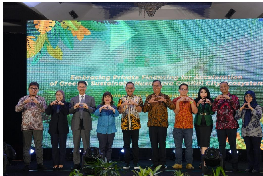
Kepala Otorita IKN, Bambang Susantono (tengah) berfoto bersama para pemateri.