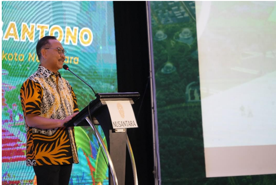
Kepala Otorita IKN, Bambang Susantono memberikan sambutannya.