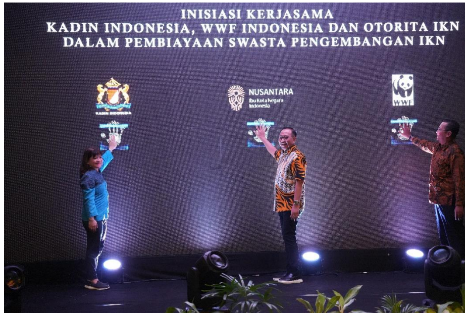
Pembukaan agenda Forum KPBU Otorita IKN-Kadin