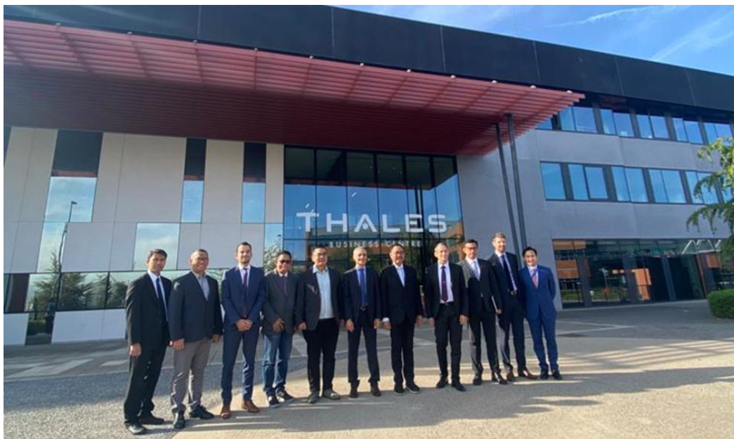
Sesi foto bersama antara Tim Otorita Ibu Kota Nusantara dengan Tim Thales.