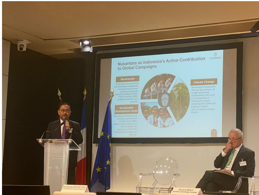
Sesi paparan oleh Kepala Otorita Ibu Kota Nusantara, Bambang Susantono